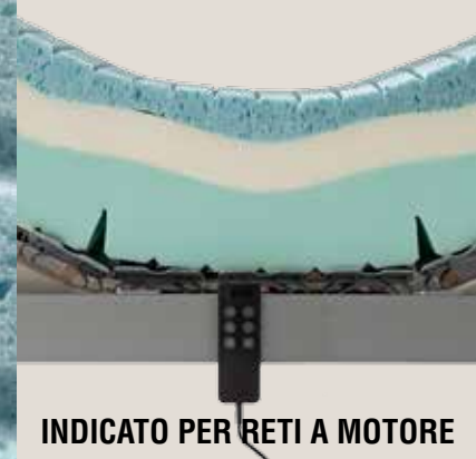
INDICATO PER RETI A MOTORE